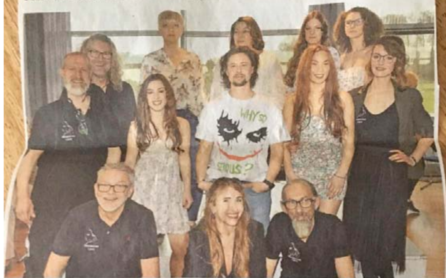
Das Modeteam der Friseurinnung Bergisches Land stellte die neuen Frisurentrends vor. Angesagt sind jetzt natürliche und wildere Strukturen.

Frisurentrends für den Frühling und Sommer 2020 vorgestellt