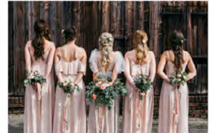
Boho-Hippie-Brautfrisuren sind bei jungen Frau sehr angesagt. Natürlich und verspielt sollen die Flechtfrisuren aussehen.

Für die Wahl der Brautfrisur ist die Länge der Haare nicht so entscheidend. Wie die Expertin erklärt, ist es auch möglich bei einem Bob die Haare zu flechten und hochzustecken, bzw. zu nähen. Die Haarfarbe spielt ebenfalls eine untergeordnete Rolle. Zwar kämen kleinere